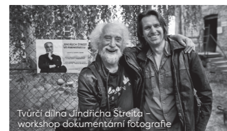
Tvůrčí dílna Jindřicha Štreita – workshop dokumentární fotografie