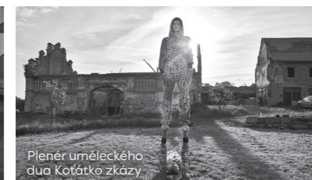
Plenér uměleckého dua Koťátko zkázy