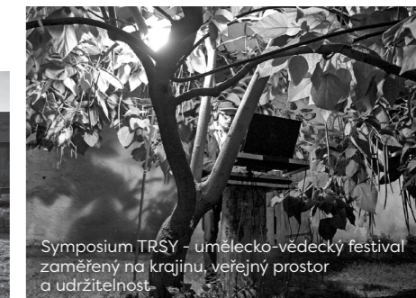
Symposium TRSY – umělecko-vědecký festival zaměřený na krajinu, veřejný prostor a udržitelnost