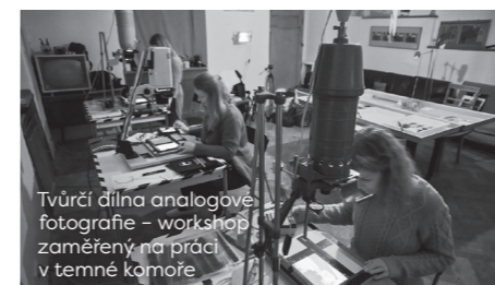
Tvůrčí dílna analogové fotografie – workshop zaměřený na práci v temné komoře