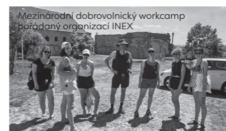
Mezinárodní dobrovolnický workcamp pořádaný organizací INEX